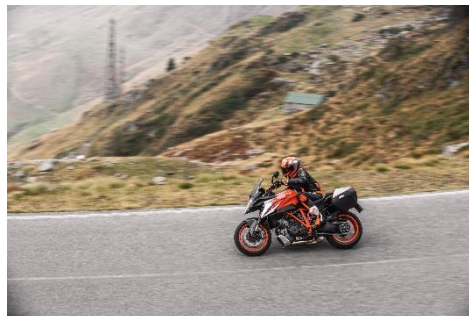
2018 KTM 1290 SUPER DUKE GT (オレンジ)

エンジン型式: 水冷4ストローク DOHC 4バルブ 75° V型 2気筒 総排気量: 1,301 cc 最高出力: 127 kW (173 hp) / 9,500 rpm 最大トルク: 144 Nm / 6,750 rpm カラーバリエーション: オレンジ 保証期間: 2年間