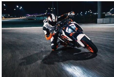
2018 KTM 1290 SUPER DUKE (ホワイト)

エンジン型式: 水冷4ストローク DOHC 4バルブ 75° V型2気筒 総排気量: 1,301 cc 最高出力: 130 kW (177 hp) / 9,750 rpm 最大トルク: 141 Nm / 7,000 rpm カラーバリエーション: ホワイト 保証期間: 2年間