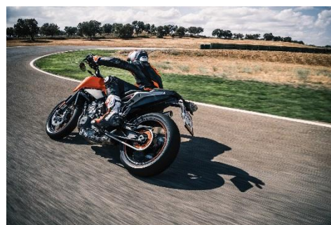
2018 KTM 790 DUKE (オレンジ)