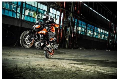
2018 KTM 125 DUKE (オレンジ)