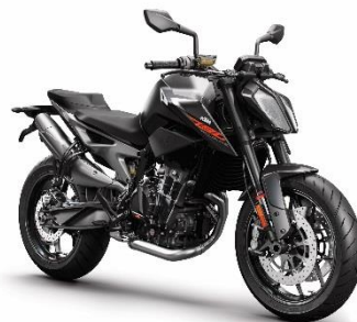
2018 KTM 790 DUKE (ブラック)

■125 DUKE 発売時期: 2018年2月中旬予定 メーカー希望小売価格: 510,000円 (車両本体価格・税込)