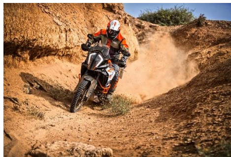
2018 KTM 1290 SUPER ADVENTURE R (ホワイト)

エンジン型式: 水冷4ストローク DOHC 4バルブ 75° V型 2気筒 総排気量: 1,301 cc 最高出力: 118 kW (160 hp) / 8,750 rpm 最大トルク: 140 Nm / 6,750 rpm カラーバリエーション: ホワイト 保証期間: 2年間