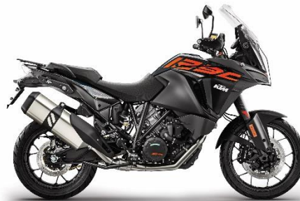
2018 KTM 1290 SUPER ADVENTURE S (ブラック)

エンジン型式: 水冷4ストローク DOHC 4バルブ 75° V型 2気筒 総排気量: 1,301 cc 最高出力: 118 kW (160 hp) / 8,750 rpm 最大トルク: 140 Nm / 6,750 rpm カラーバリエーション: ブラック 保証期間: 2年間