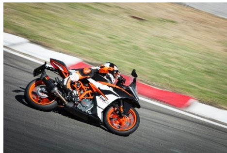
2018 KTM RC 390 (ブラック)

エンジン型式: 水冷 4 ストローク DOHC 4バルブ単気筒 総排気量: 373.2 cc 最高出力: 32 kW (44 hp) / 9,500 rpm 最大トルク: 35 Nm / 7,250 rpm カラーバリエーション: ブラック 保証期間: 2年間