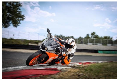
2018 KTM RC 250 (オレンジ)

エンジン型式: 水冷 4 ストローク DOHC 4バルブ単気筒 総排気量: 248.8 cc 最高出力: 23 kW (31 hp) / 9,000 rpm 最大トルク: 24 Nm / 7,250 rpm カラーバリエーション: オレンジ 保証期間: 2年間