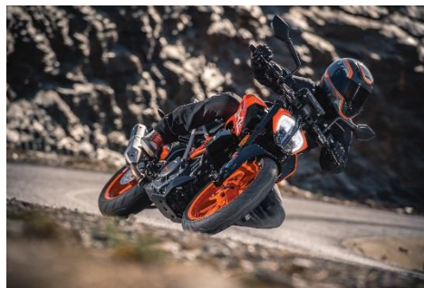
2018 KTM 390 Duke (オレンジ)

エンジン型式: 水冷4ストローク DOHC 4バルブ単気筒 総排気量: 373.2 cc 最高出力: 32 kW (44 hp) / 9,000 rpm 最大トルク: 37 Nm / 7,000 rpm カラーバリエーション: オレンジ/ホワイト 保証期間: 2年間