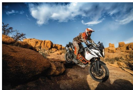
2018 KTM 1090 ADVENTURE R (ホワイト)

エンジン型式: 水冷4ストローク DOHC 4バルブ 75° V型2気筒 総排気量: 1,050 cc 最高出力: 92 kW (125 hp) / 8,500 rpm 最大トルク: 109 Nm / 6,500 rpm カラーバリエーション: ホワイト 保証期間: 2年間