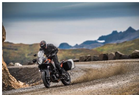
2018 KTM 1090 ADVENTURE (ブラック)

エンジン型式: 水冷4ストローク DOHC 4バルブ 75° V型2気筒 総排気量: 1,050 cc 最高出力: 92 kW (125 hp) / 8,500 rpm 最大トルク: 109 Nm / 6,500 rpm カラーバリエーション: ブラック 保証期間: 2年間